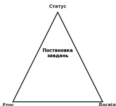
Рисунок 1. Постановка завдань у відносинах консультування та державного управління [21].

Таким чином, визнання є реляційним явищем і залежить від взаємної оцінки учасників, яка базується на відповідності їхнього етосу, знань і статусу встановленим критеріям.