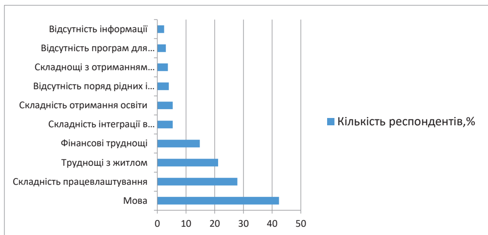
Таблиця 4. Труднощі, з якими стикаються українські біженці в країнах тимчасового перебування (за результати опитування ГО «Інститут молоді»)

Ці люди змушені були залишити свої домівки, але залишаються в межах країни. Масштаби та складність проблеми переміщення призвели до напруження ресурсів і створили значні гуманітарні та соціальні проблеми як для України, так і для країн, які приймають біженців. Так, наприклад, за опитуванням, що провело ГО «Інститут молоді» [12], найбільш поширеними труднощами, з якими стикаються українські біженці за кордоном є: