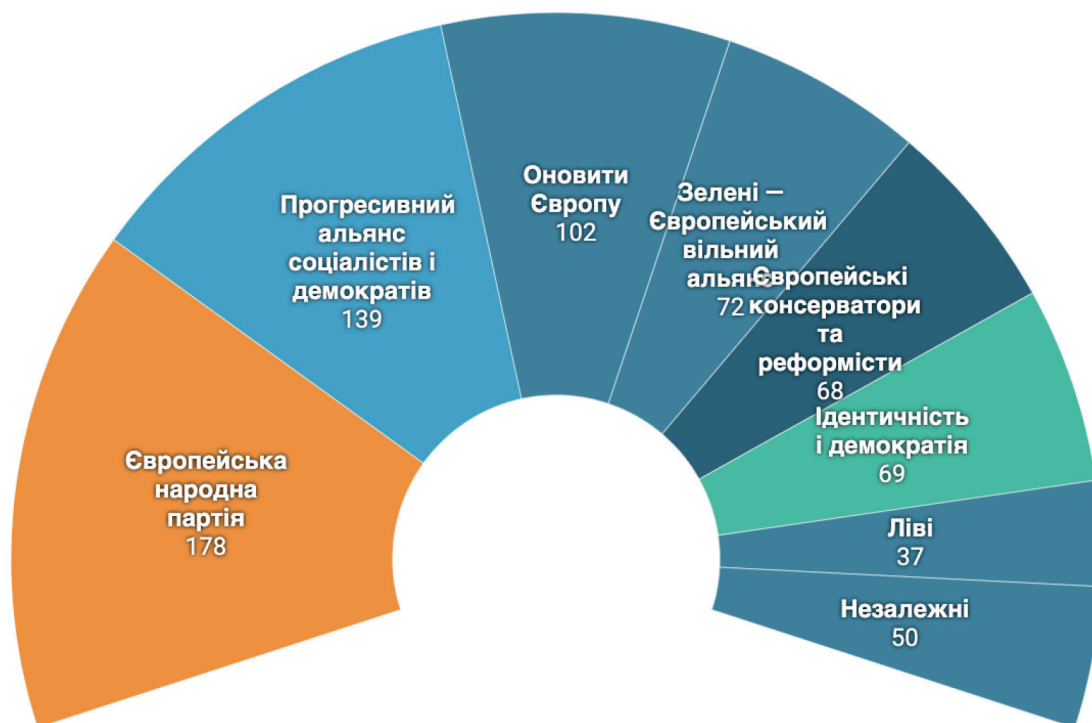
Рисунок 2. Розподіл депутатів за основними партіями, квітень 2024

Депутати можуть формувати групи відповідно до політичних уподобань незалежно від національності. Європарламент представлений сімома основними партіями, серед яких найбільшою є Європейська народна партія (178 депутатів). Другою за чисельністю виступає Прогресивний альянс соціалістів і демократів (139). Ще 50 депутатів засідають як незалежні (Рисунок 2).