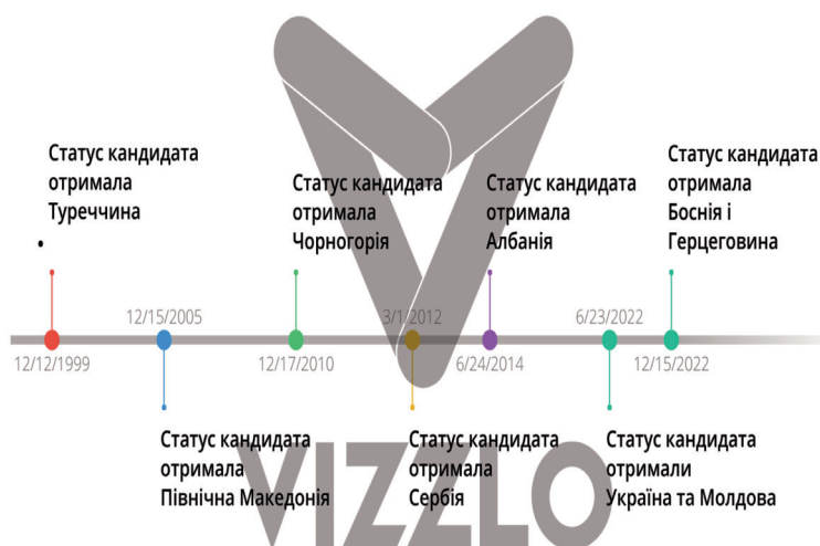
Рисунок 1. Держави, які мають статус кандидата на вступ до ЄС

Наразі статус держави-кандидата на вступ мають сім держав. При цьому Туреччина отримала цей статус ще 24 роки тому, але переговорний процес між нею та ЄС заморожений. Останньою ж статус отримала Боснія і Герцеговина (Рисунок 1). До потенційних кандидатів також відносять Грузію та Косово.